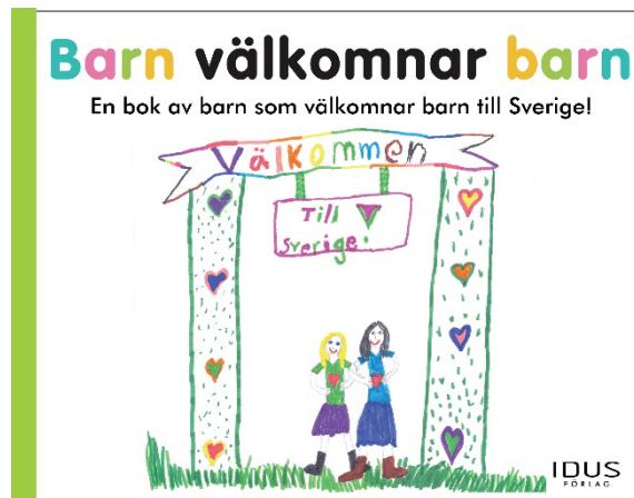
Bild på första upplagan Barn välkomnar barn som kom ut 2016

Med anledning av kriget i Ukraina och dess följder känns det angeläget att återigen lyfta upp möjligheten för barn att samtala om integration, öppenhet och gemenskap genom att skicka in bidrag till en ny version av boken Barn välkomna barn .